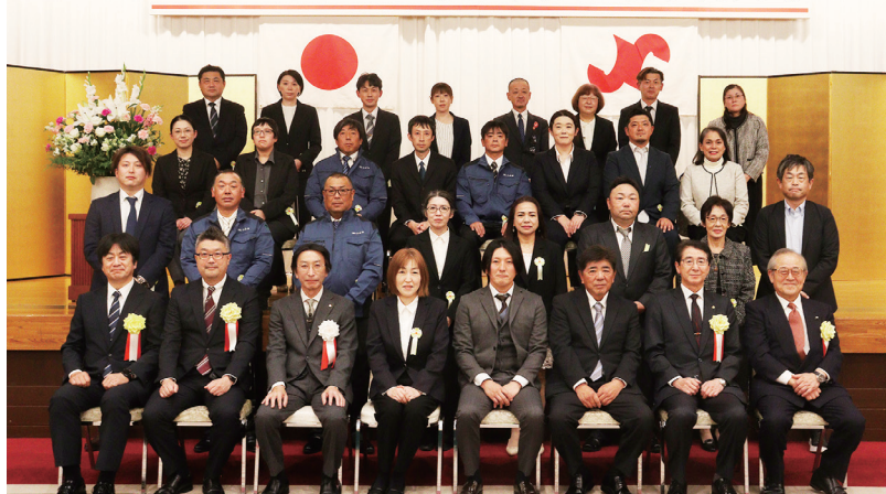
久慈商工会議所会頭表彰・ 勤続10年・5年以上 受賞者

11月21日（金）、久慈グランドホテルにおいて令和7年度優良勤労者表彰式を開催しました。