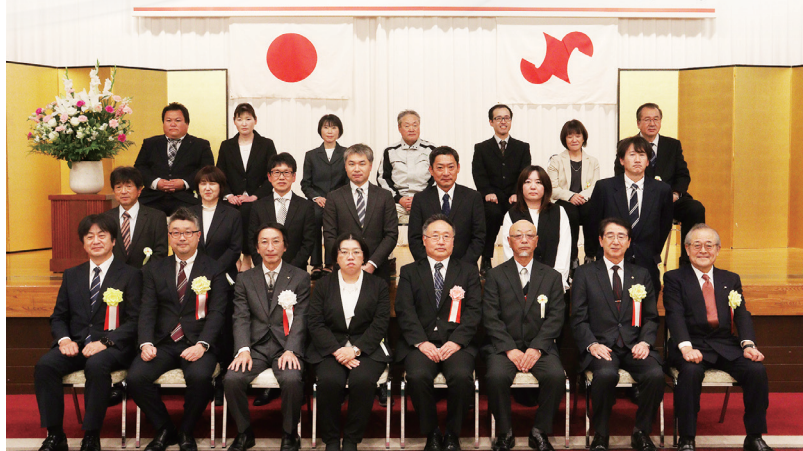
日本商工会議所会頭連名表彰・ 岩手県商工会議所連合会会長連名表彰 受賞者