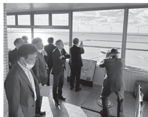
洋上風力発電施設の見学

日本海次世代エネルギー協議会との意見交換の場では、当協議会の参加者から地元関係者との合意形成、地元企業の参入、雇用及び観光等について活発な意見交換が行われました。