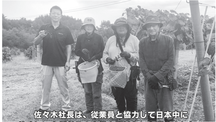
佐々木社長は、従業員と協力して日本中に美味しい山ぶどうの商品を届けたいと語りました。