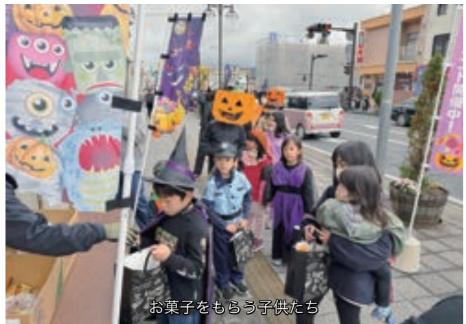
お菓子をもらう子供たち

10月29日（日）、中心市街地において「まちなかハロウィン2023」を開催しました。