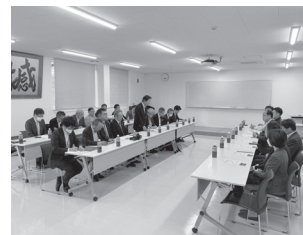
日本海次世代エネルギー協議会と意見交換