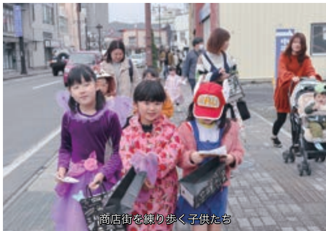
商店街を練り歩く子供たち