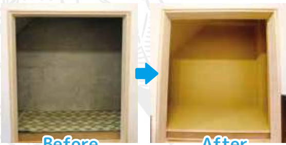
Before After 収納の塗装 DIY