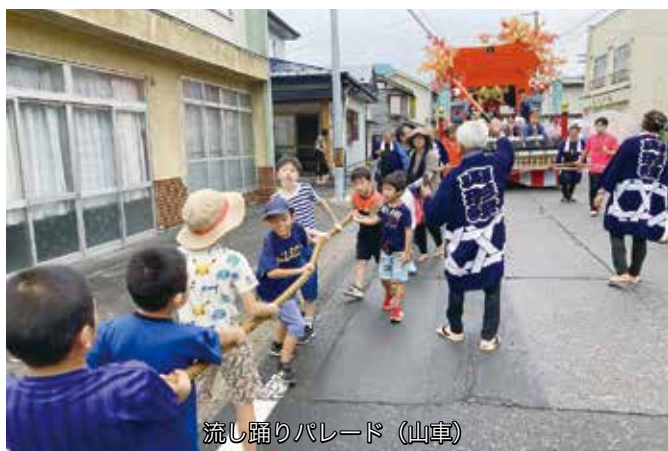
流し踊りパレード (山車)