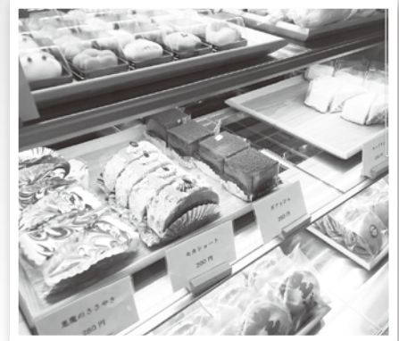
(有)みかわ屋製菓の店内の様子