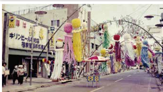
昭和46年頃の商店街