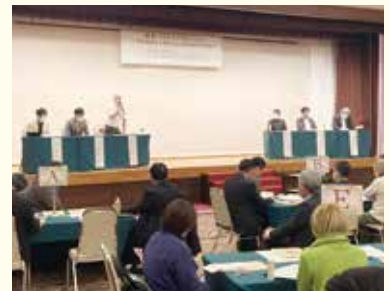
新春パネルディスカッションの様子