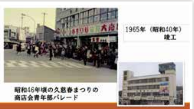
昭和46年頃の久慈春まつりの商店会青年部パレード