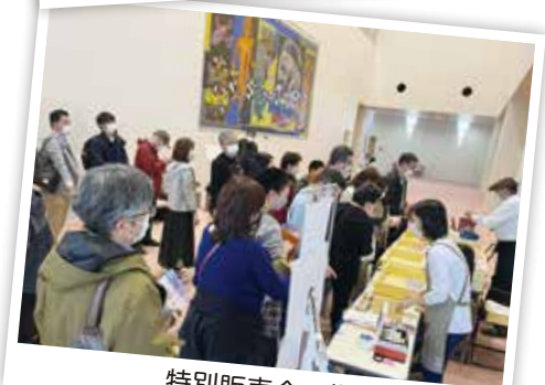
特別販売会の様子