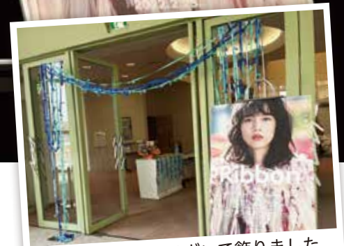
会場の入口をリボンで飾りました

同日、(有)みかわや製菓と(有)沢菊による、会場でのKUJI×Ribbonプロジェクトのコラボメニューの特別販売会が行われ、多くの方がメルヘンリング（ドーナツ）やRibbonネコ（和菓子）等のRibbonコラボ商品を購入していました。