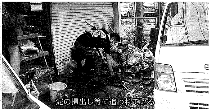
泥の掃出し等に追われている