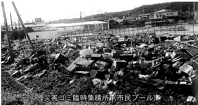
災害ゴミ臨時集積所(市民プール)