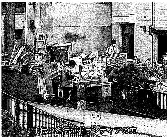
手伝いを行うボランティアの方