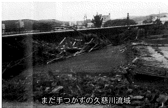
まだ手つかずの久慈川流域