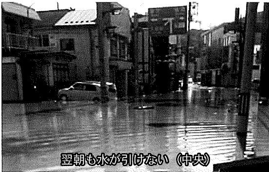
翌朝も水が引けない(中央)