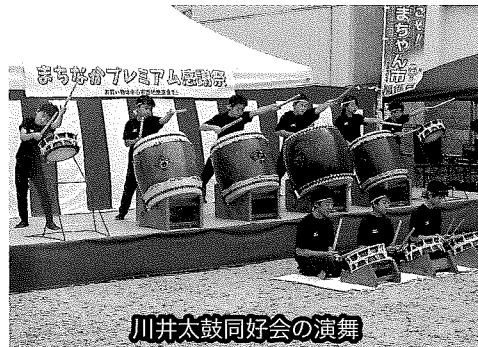
川井太鼓同好会の演舞

7月18日(土)、みちのく銀行久慈支店駐車場を会場に「まちなかプレミアム感謝祭」を開催した。