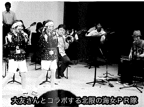
大友さんとコラボする北限の海女PR隊