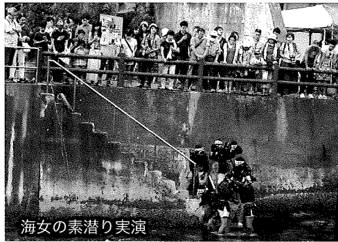
海女の素潜り実演