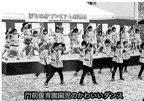
門前保育園園児のかわいいダンス