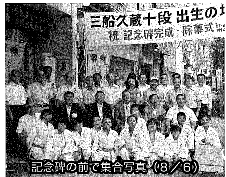
記念碑の前で集合写真(8/6)

抽選会が行われ、会場から溢れるほどのお客さんが集まり、熱気と期待が会場を包んだ。 8月6日からの祭りでは、各商店街で見応えあるイベント等が行われた。十段通り商店街歩行者天国では、保育園のダンスや書道パフォーマンスが催されたほか、銀座商店街ではビンゴ大会等、駅前商店街では有志バンド演奏やパントマイムショー等、本町商店街ではからふるヨーヨー祭りなどを開催し、中心商店街全体で楽しめるイベントを実施した。 また、6日(木)ふくしサロンしあわせSUN前で、三船久蔵十段出生の地記念碑完成の除幕式が行われた。