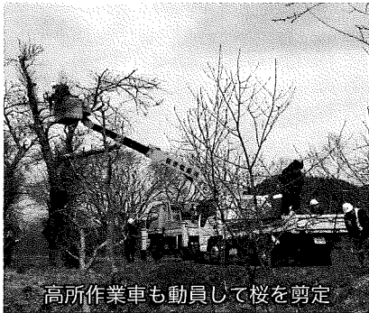
高所作業車も動員して桜を剪定

の参加のもと実施し、久慈川・夏井川等堤防沿いの桜木の剪定作業を行った。作業には高所作業車やチェーンソー等を用いて普段手の届かない場所の剪定も行った。