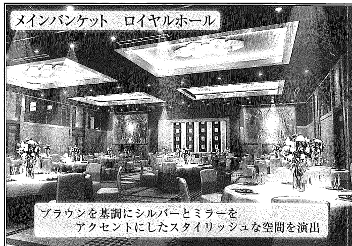
メインバンケット ロイヤルホール