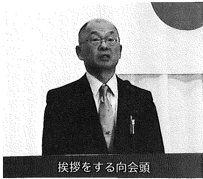
挨拶をする向会頭

3月26日(木)午後5時30分 から久慈グラウンドホテルに おいて第70回通常議員総会を 開催した。総会には、委任状 を含め、議員53名が出席し、 平成27年度事業計画案及び予 算案が承認された。