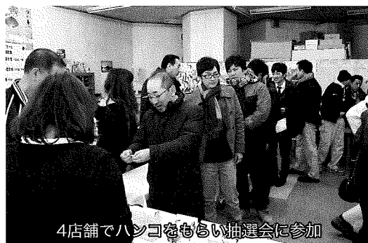
4店舗でハンコをもらい抽選会に参加

抽選会で回収したアンケート結果からは、「楽しかった」「初めて行くお店があつて新鮮だった」等の意見のほか、「年に数回開催してほしい」等の意見もきかれ、これらのアンケート結果に基づいて来年度も引き続き継続していくこととしている。