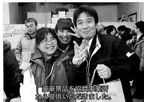
豪華景品を協賛事業所から提供いただきました。