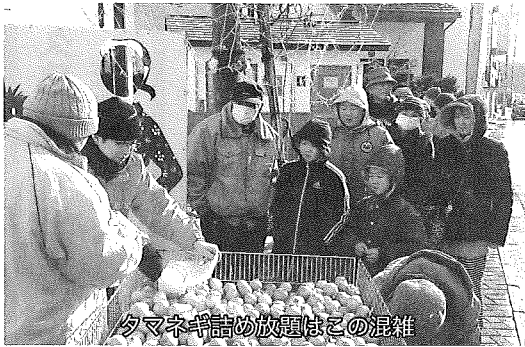
夕マネギ詰め放題はこの混雑