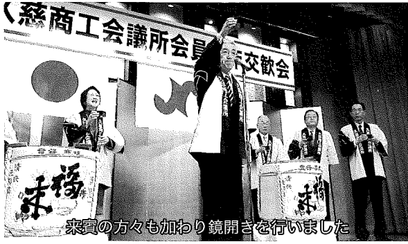
来賓の方々も加わり鏡開きを行いました

続いて鏡開きを行い、遠藤譲一久慈市長、鈴木俊一衆議院議員(代理)・鈴木敦子夫人、嵯峨吉朗岩手県議会議員、清水恭一岩手県議会議員、八重櫻友夫久慈市議会議長、及川勝朋釜石港湾事務所副所長、澤田徳伸久慈警察署