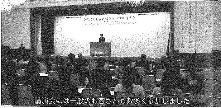
講演会には一般のお客さんも数多く参加しました