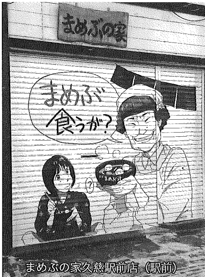
まめぶの家久慈駅前店(駅前)

完成したのは、まめぶの家久慈駅前店(駅前)と西村フォト(本町)の2か所で、これまで同様プロの漫画家等から原画の提供を受けたものを地元業者と地元高校美術部の協力で描いているもので新