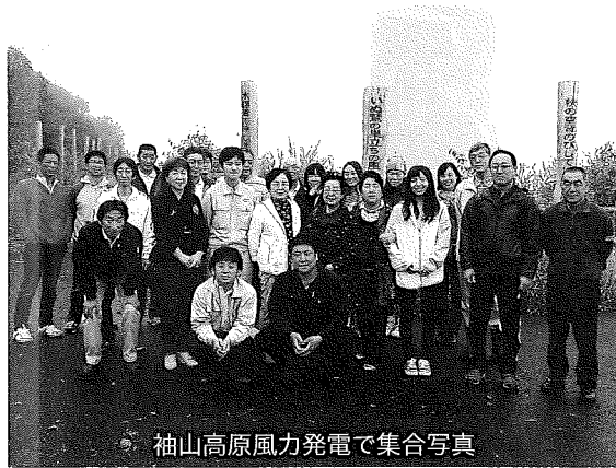
袖山高原風力発電で集合写真

「商品券」は新規のお客様を獲得するチャンスです。商品券の使用がお得な独自のセールなどを開催し、売り上げアップ・顧客獲得など実施効果につなげましょう！