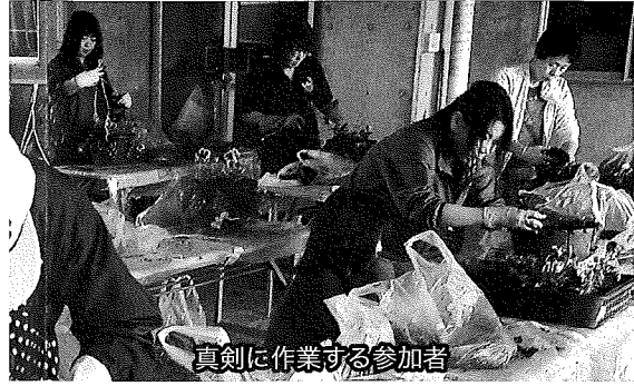
真剣に作業する参加者

9月18(金)〜20日(日)久慈秋まつり期間中、まちなか交流スペース・ふらっとで集客イベントを実施した。 子どもに人気のスーパーボールすくいや風船つりなどを無料で提供したほか、特別企画のネイルコーナー、縁日コーナーなどを同時開催し、多くの来客で賑わった。「ふらっと」では、ふらっとカルチャー講座なども随時開催しています。お気軽にご来店ください。