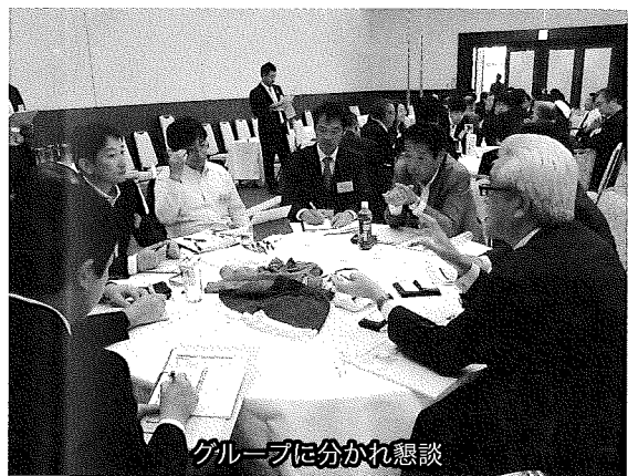
グループに分かれ懇談