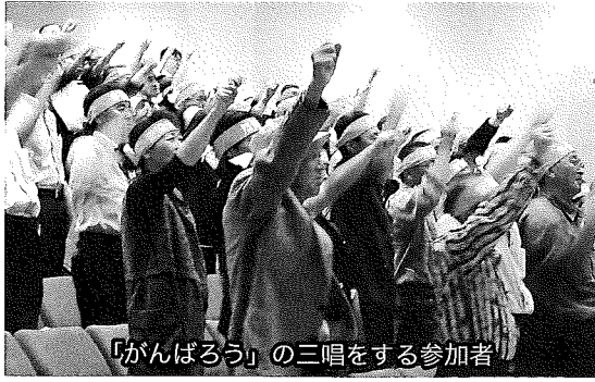
「がんばろう」の三唱をする参加者