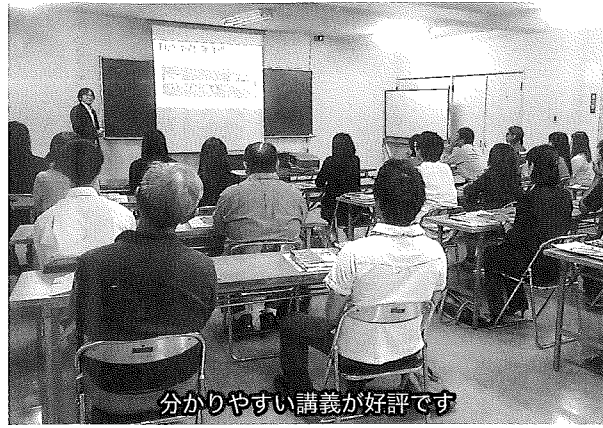
分かりやすい講義が好評です

10月7日(水)久慈グランドホテルにおいて第1回消費税転嫁対策セミナーを開催した。「増税に備えた人材確保・会社内部の実務強化」では、マイナンバー制度導入後の実務対応のポイントについて、全体像の把握、利用する事務の特定、安全管理措置の手法について体系的に学習した。