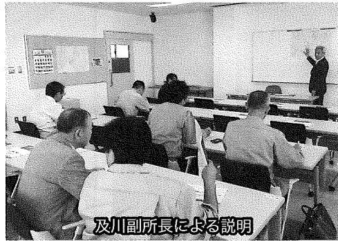
及川副所長による説明