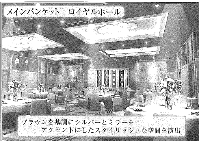
メインバンケット ロイヤルホール