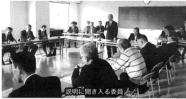
説明に聞き入る委員

画策定が必要なことから、基本計画の内容を見直すこととし、平成26年度の補助金申請は行わないこととした。今後は、市総合発展計画の中でも中心市街地の活性化施策を位置付けていく」旨が説明された。 委員からは、駅前再開発の必要性や、各種ソフト事業に対する支援、見直しにあたってはスピード感をもった対応を求める意見等が出された。