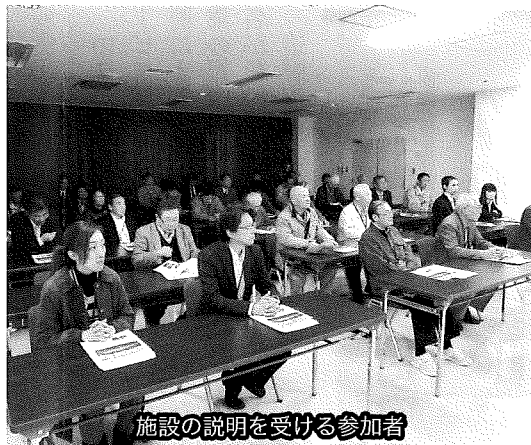
施設の説明を受ける参加者

10月24日(金)久慈地区エネルギー協議会・工業運輸業部会共催による視察研修を実施し、久慈国家石油備蓄基地を視察した。 施設の概要や、東日本大震災で壊滅的な被害を受けた施設が復旧に至るまでの経緯が説明されたほか、施設が被災する様子を撮影した動画が上映されると会場からはどよめきがおこり、津波被害の甚大さを改めて感じてい