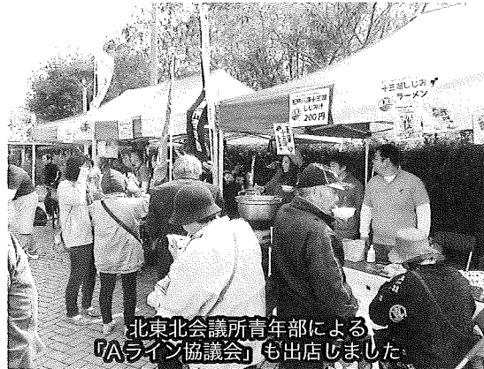
北東北会議所青年部による「Aライン協議会」も出店しました

10月18日(土) 19日(日)の2日間にわたる第45回久慈地方産業まつりがアンバーホールにおいて開催された。2日間とも天候にも恵まれ多くのお客さんで賑わった。当所が主管する「商工まつり」部門では20の事業所や団体が、また、昨年に引き続き青森・秋田・岩手の3県の商工会議所青年部で組織される「Aライン協議会」から「黒石風太麺焼そば」「五所川原十三湖しじみ汁」「大館みそつけたんぼ」「八戸せんべい汁」「能代ブヒ串」が出店して賑わいを創出したほか、当所女性会による廃油を再利用した手作り石鹸の販売とリサイクルバザーなども行われた。