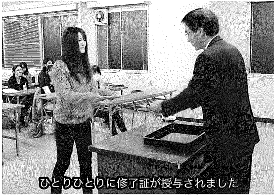
ひとりひとりに修了証が授与されました