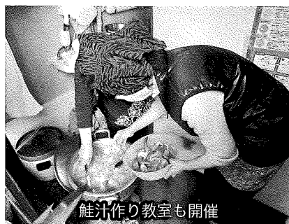
鮭汁作り教室も開催

10月18日(土)で北三陸あまちゃん市を中心商店街で開催した。みちのく銀行久慈支店駐車場の特設会場において、鮭汁の振舞いを行い、抽選会に参加したお客さんをもてなした。次月は11月18日(火)に開催する。