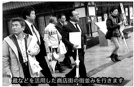
蔵などを活用した商店街の街並みを行きます

10月28日(火)、商業・サービス業・観光交通業部会共催による遠野市中心市街地事業の視察研修会を開催し、10名が参加した。遠野市商工観光課や商工会