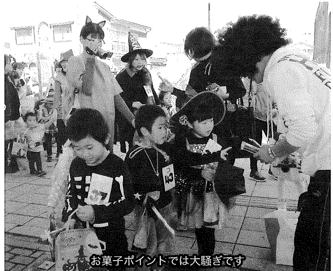
お菓子ポイントでは大騒ぎです