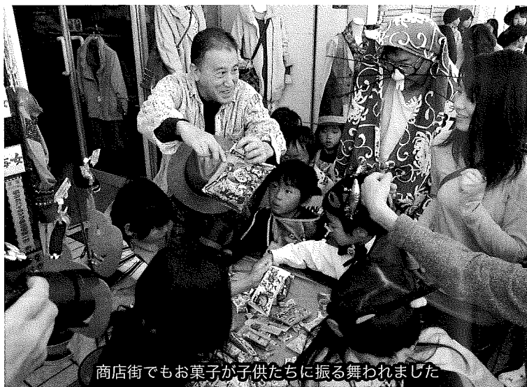
商店街でもお菓子が子供たちに振る舞われました