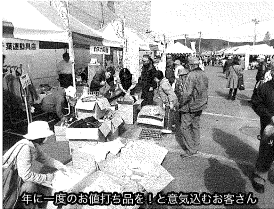
年に一度のお値打ち品を！と意気込むお客さん