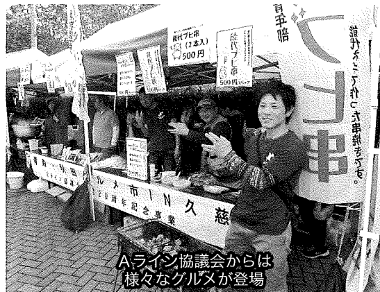
Aライン協議会からは様々なグルメが登場