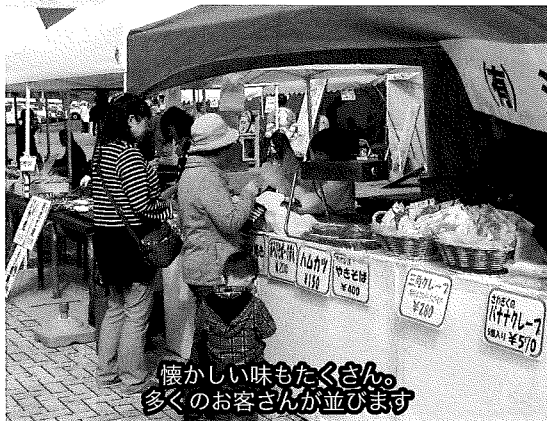
懐かしい味もたくさん。多くのお客さんが並びます

10月18日(土) 19日(日)の2日間にわたる第45回久慈地方産業まつりがアンバーホールにおいて開催された。2日間とも天候にも恵まれ多くのお客さんで賑わった。当所が主管する「商工まつり」部門では20の事業所や団体が、また、昨年に引き続き青森・秋田・岩手の3県の商工会議所青年部で組織される「Aライン協議会」から「黒石風太麺焼そば」「五所川原十三湖しじみ汁」「大館みそつけたんぼ」「八戸せんべい汁」「能代ブヒ串」が出店して賑わいを創出したほか、当所女性会による廃油を再利用した手作り石鹸の販売とリサイクルバザーなども行われた。