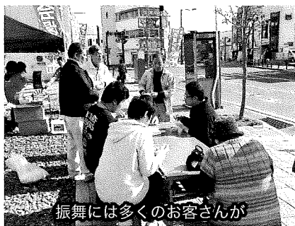
振舞には多くのお客さんが