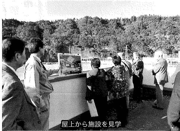
屋上から施設を見学

た。 座学での研修の後、施設の屋上から、被災し新たに防潮扉の設置されたトンネル等を見学したほか、津波等による電源の消失を防ぐために新たに設置した電源施設等、新たな安全対策についての取り組みについても研修した。