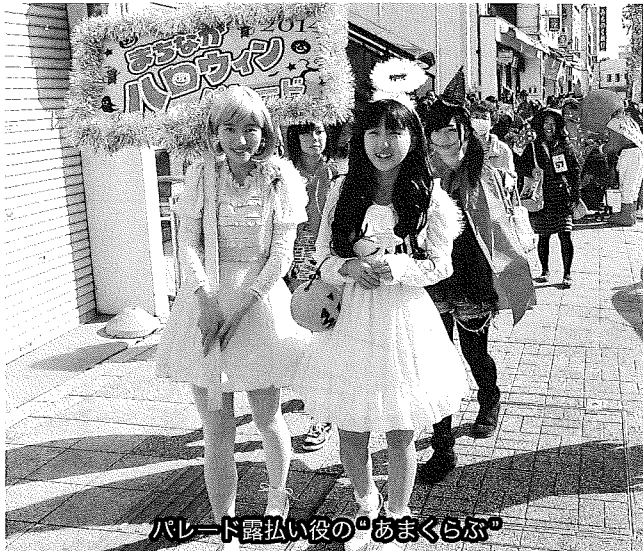
パレード露払い役の「あまくらぶ」